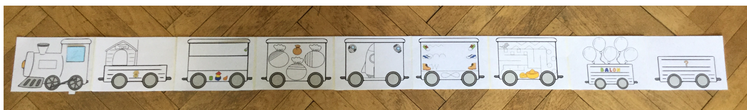
5. Leporelo Str.1

Kompletní materiál obsahuje: 1x Lokomotiva ,8x Vagónek, 2x Pohyblivý prvek, 12x Obrázek k velkému grafomotorickému cvičení